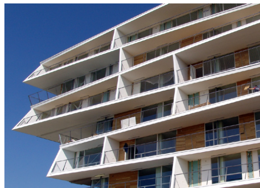
BRAMBERGER architects, Graz, Österreich, nutzt ProjektPro zur wirtschaftlichen Steuerung: Tartu Rebase Street in Estland

Das Modul ProjektControlling arbeitet „dynamisch“, das heißt, betriebswirtschaftliche Daten sind stets miteinander verknüpft und werden zu jedem Zeitpunkt zueinander in Beziehung gesetzt. Auf einen Blick können Sie Aussagen über die aktuelle Wirtschaftlichkeit Ihrer Projekte treffen und Hochrechnungen durchführen, aus denen Sie